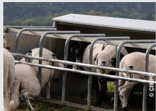
Ce système marque les agneaux qui entrent dans le parc sélectif du nourrisseur

Apporter un aliment concentré aux agneaux élevés à l'herbe sous la mère n'est pas une obligation. Lorsque les brebis produisent suffisamment de lait, leur croissance est peu modifiée. Cette pratique facilite toutefois la transition alimentaire si les agneaux sont finis en bergerie après le sevrage. La fréquentation du nourrisseur est liée à la qualité de l'herbe disponible : plus l'herbe est feuillue, moins les agneaux consomment de concentré. Et il peut arriver qu'ils en mangent trop peu pour éviter les problèmes sanitaires lors de la transition. De plus, certains agneaux préfèrent faire manger de l'herbe que de consommer du concentré.