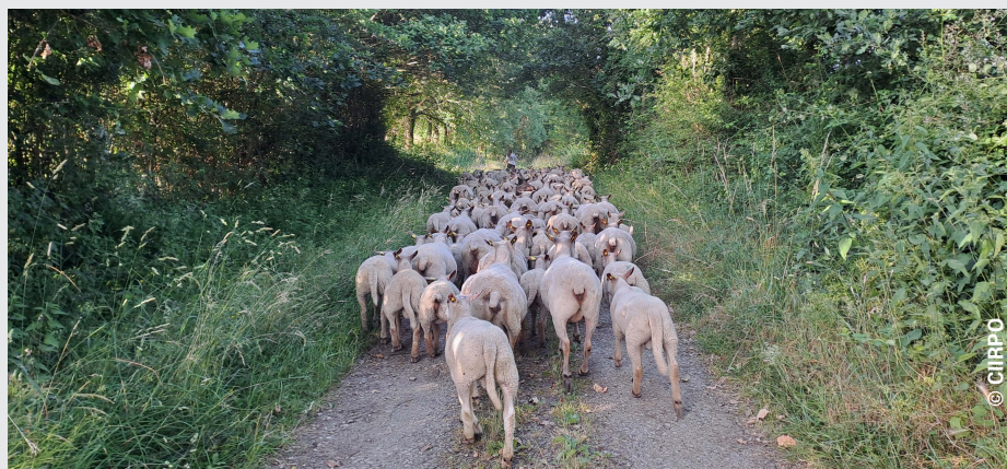
Les agneaux d'herbe sont sevrés plus tôt